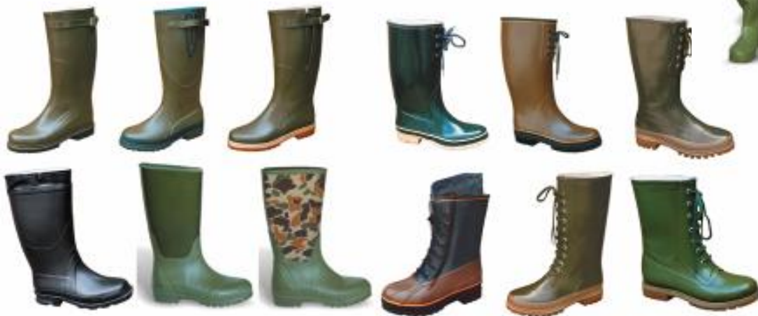
Gumena obuća za lov (Hunting rubber boots)