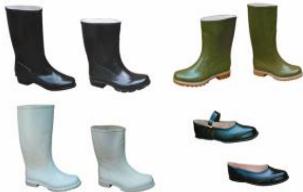
Gumena obuća opšte namene (Working rubber footwear)