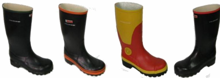
Obuća za gradjevinarstvo