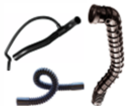
Fleksi cevi i cevi za autoindustriju