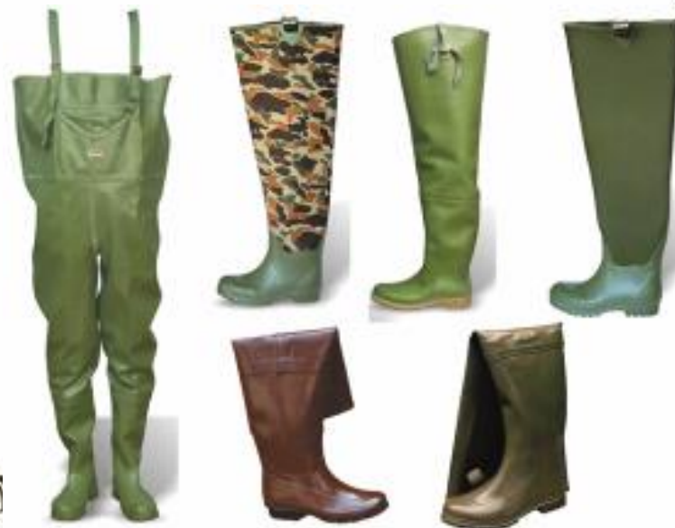
Gumena obuća za ribolov (Fishing rubber boots)