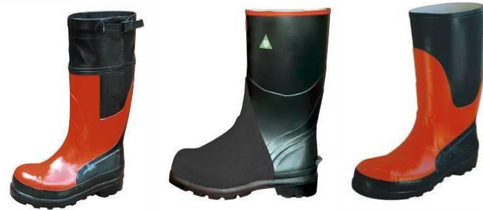
Obuća za rudarstvo